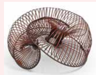
Sugiura Noriyoshi Reimei

Vers 2017, région de Kyushu, bambou et rotin, avec tomobako (boîte), 27 x 45 x 41 cm. Galerie Mingei, Paris.