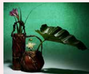
Hanakago (paniers à anse pour l'ikebana)

Début de l'ère Showa (1926-1989), bambou fumé et laqué tressé librement. Galerie Stimmung, Paris.