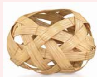
Matsumoto Hafu Hiratake hanakago

Vers 2008, région de Kanto, bambou, 52 x 80 x 80 cm. Galerie Mingei, Paris.